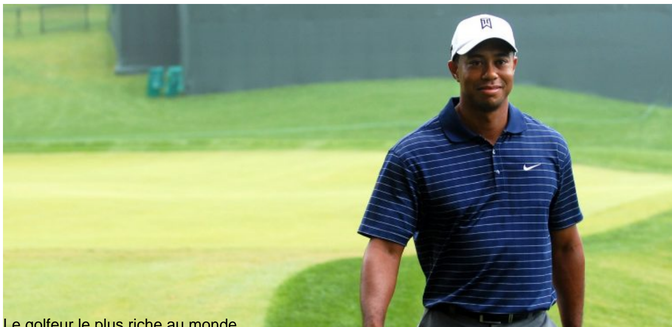
Le golfeur le plus riche au monde