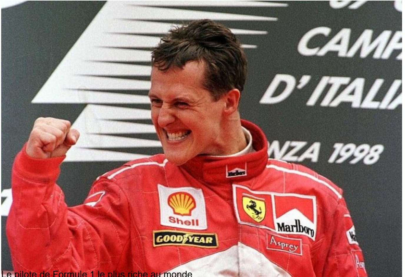
Le pilote de Formule 1 le plus riche au monde

Fortune estimée : 700 millions de dollars