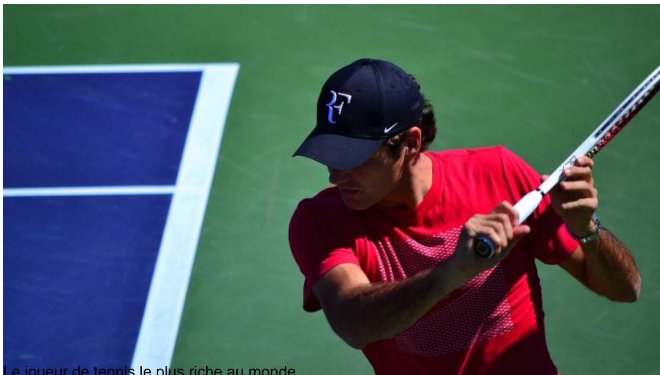
Le joueur de tennis le plus riche au monde

Fortune estimée : 450 millions de dollars