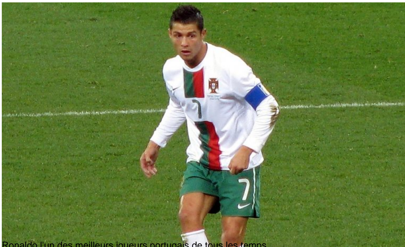
Ronaldo l'un des meilleurs joueurs portugais de tous les temps

Fortune estimée : 450 millions de dollars