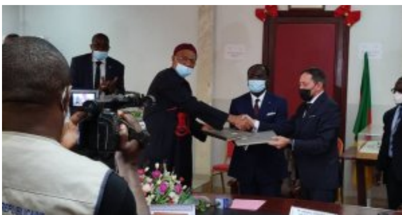
La prolongation du contrat de Toni Conceição à la tête des Lions Indomptables.

Toni Conceição a été nommé à la tête des Lions Indomptables par le Ministre Mouelle Kombi. Plus tard, sera communiquée une décision de la FECAFOOT portant nomination de tous les membres de l'encadrement. En se référant aux cas des trois derniers sélectionneurs de cette équipe, fort est de constater qu'ils ont tous signé leurs contrats au cours d'une cérémonie présidée par le Ministre des Sports. Au cours de cette cérémonie, trois parties (Ministre des sports, président de la FECAFOOT et entraîneur) signent le contrat qui lie le nouveau technicien à la sélection du Cameroun. Sans avoir à rentrer dans plus de détail, les faits ainsi établis laissent entrevoir une collaboration saine entre MINSEP et FECAFOOT.