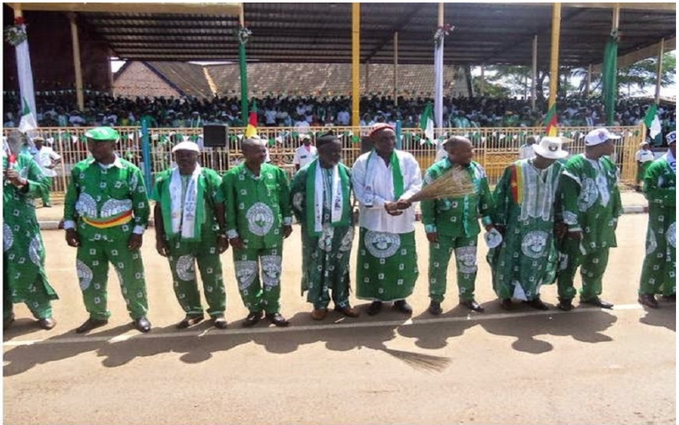
SDF Militants At 25 th Anniversary Celebrations in Bamenda